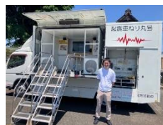
起震車ねり丸号と 錦一・二丁目町会若手会員

近隣町会合同の防災訓練に参加しました。晴天のもと会場の金乗院大駐車場は老若男女多くの方で賑わいました。起震車体験コーナーで震度7を体験するお母さんを最初は心配そうに…しばらくすると笑顔で見守る男の子の姿や、キッズ用防火衣を着て消防署員と消防車の前で記念撮影する女の子の姿を目にするなど、小さなお子様でもしっかりと学び楽しめるイベントとなっているのが印象的でした。町会のみなさま、おつかれさまでした！！