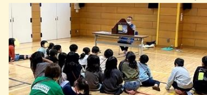
出張おはなし会を開催した様子

宿題をする子、ボードゲームを囲む子、ドッジボールに夢中になる子、料理や音楽を楽しむ中高生。館内には、年齢の違う子どもたちがゆるやかにかわりながら過ごす日常があります。