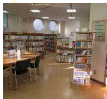
児童コーナー・青少年コーナー