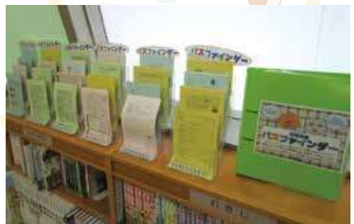
パスファインダー置き場