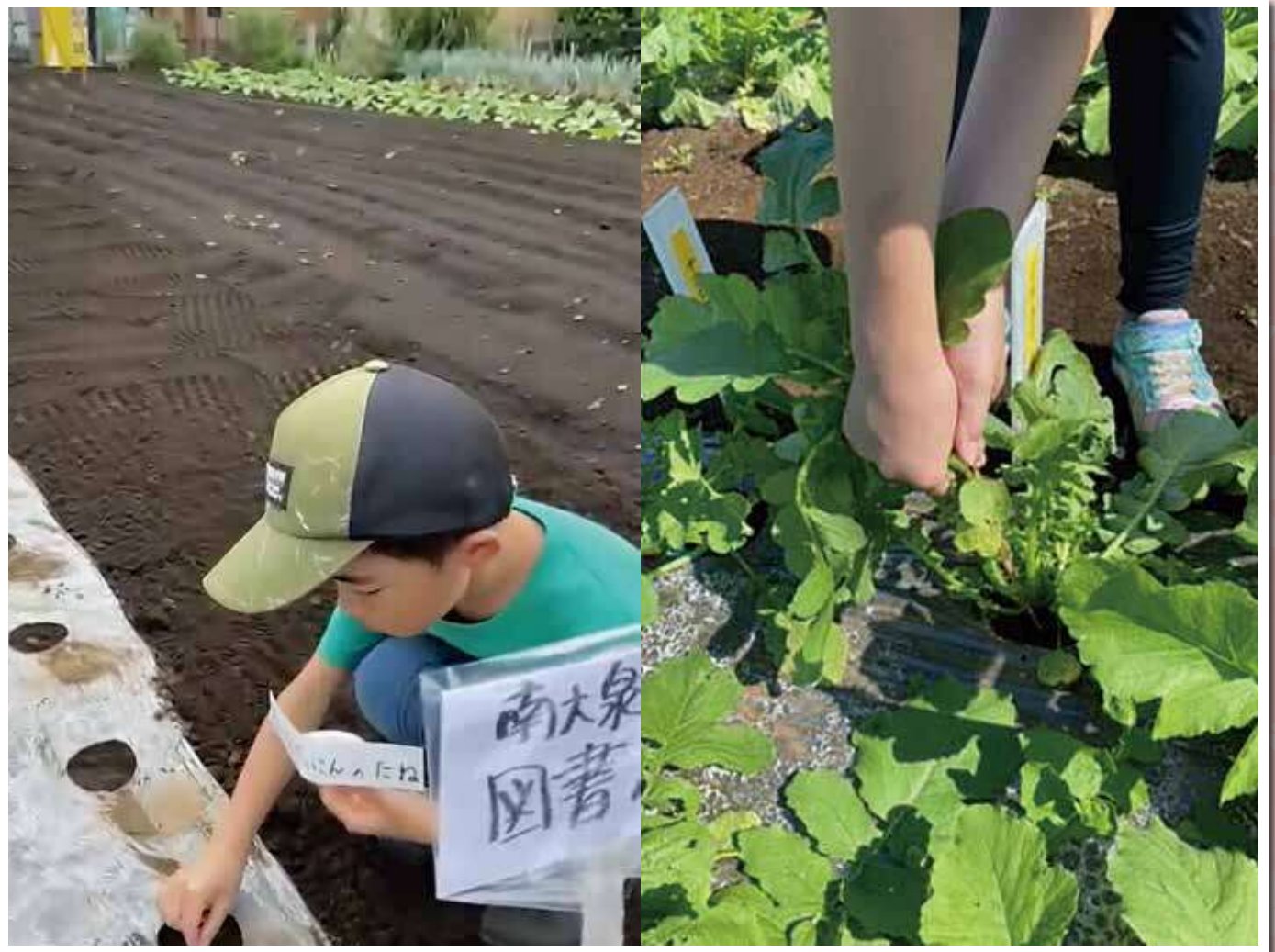
南大泉図書館(「だいこんしゅうかくたいけん」の様子)