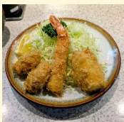
名物「おこのみ定食」 (エビ・ひとロ・クリーム) ご飯、味噌汁、お新香付き