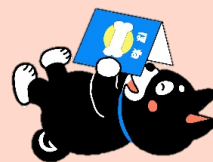
平和台図書館キャラクター へいわんクン