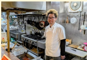
義理のお父様(二代目)を手伝う形で厨房に入り、一から料理を学んだという三代目の倉光さん。

地域に根づき、世代を超えて通う店現在の店舗は創業時と同じ敷地に平成19年に新築されました。メニューの多くは創業当時のままです。昼間は近隣で働く人々で賑わい、夜は仕事帰りの会社員や家族連れなど、幅広い世代が訪れます。20年ぶりに訪れたお客さんから「変わらない味ですね」と声をかけられることもあるそうです。時代が変わっても地域に愛され続ける味と店の歩みがありました。